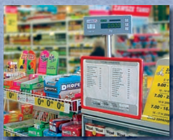
Dobrze widoczny wyświetlacz na stanowisku kasowym