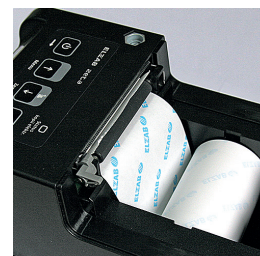
Mechanizm drukujący auto-load