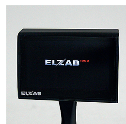
Opcja: wolnostojący, kolorowy wyświetlacz TFT

„Mała drukarka z długą rolką papieru i dużymi możliwościami. Przez podłączenie wolnostojącego wyświetlacza klienta pozwala swobodnie zaaranżować stanowisko sprzedaży.”